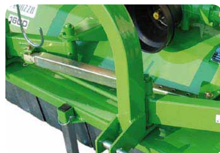
Ručno bočno pomicanje kod priključka u 3 točke.