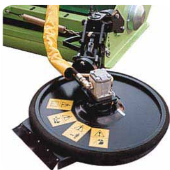
Rotacijska kosilica na hidraulični pogon za uređenje okoliša stabala i prepreka.

Model kosilice BULL , zahvaljujući svojoj raznolikosti i brojnim mogućnostima, može se upotrebljavati za održavanje zelenih površina (kao što su parkovi, aerodromi, prometnice) kao i za usitnjavanje ostataka rezidbe u vinogradima i voćnjacima te za košnju visoke trave. Upotrebom posebnih čekića (mlatilica) visoke čvrstoće, dobija se fino usitnjeni materijal.