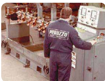
Dinamičko balansiranje osovine mlatilica.