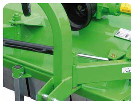
Hidraulično bočno pomicanje kod priključka u 3 točke.