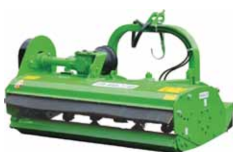
Djelomično stražnje otvaranje okvira - CE sigurnost.